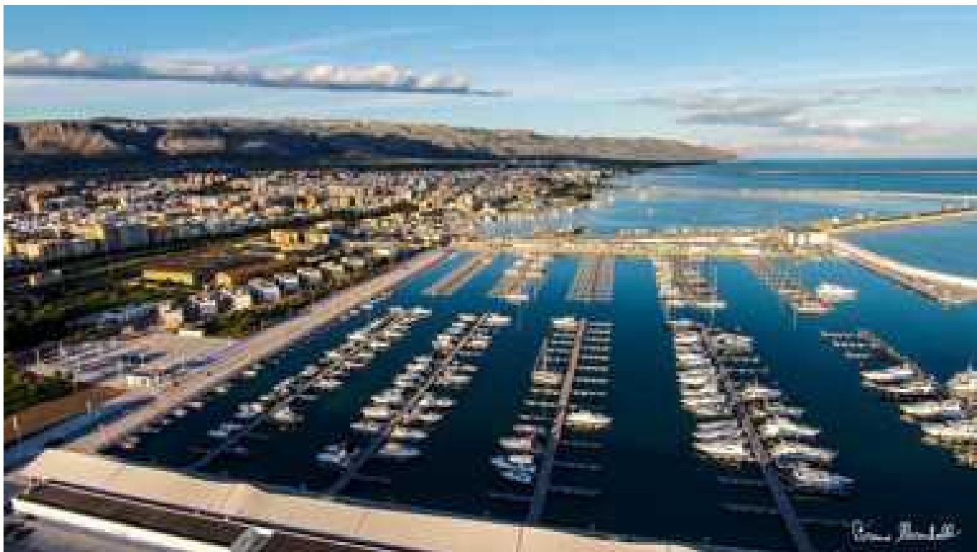
Il Marina del Gargano a Manfredonia - Veduta

S ette porti pugliesi ricevono il vessillo 'Bandiera Blu' per gli approdi della FEE - Foundation for Environmental Education. Di questi, due afferiscono al Gargano e sono il porto 'Marina del Gargano' di Manfredonia e il porto 'Maria della Libera' di Rodi Garganico.