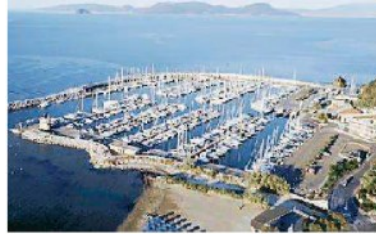
Una veduta del porto di Salivoli