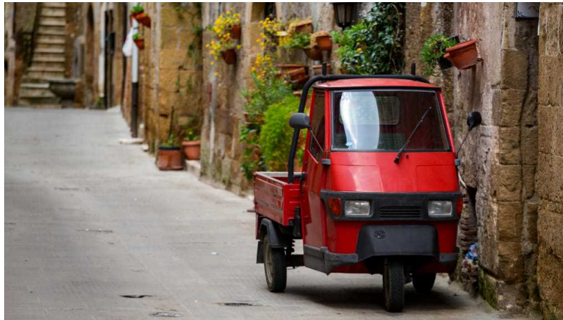
In Apecar alla scoperta di Ischia

intraprendere un trekking nello scenario di Capo Caccia e concludere con un aperitivo all'aria aperta per ammirare il panorama. Seguirà poi il rientro per la visita al Museo del corallo .