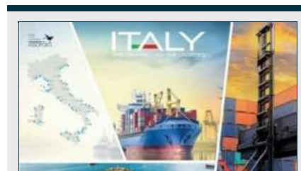
1 La Settimana dei Porti Italiani